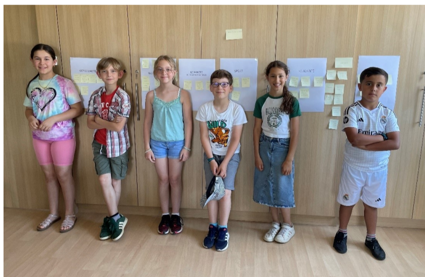
Une partie des enfants du CME durant une réunion de travail sur les nouveaux projets